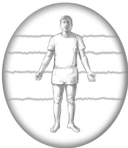
Roztřesené šedivé čáry – nemoc.