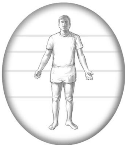
Stříbřitě bílé čáry – vynikající zdraví.